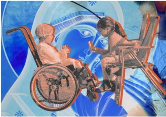
Illustration: Émilie Dubern/Le Verbe